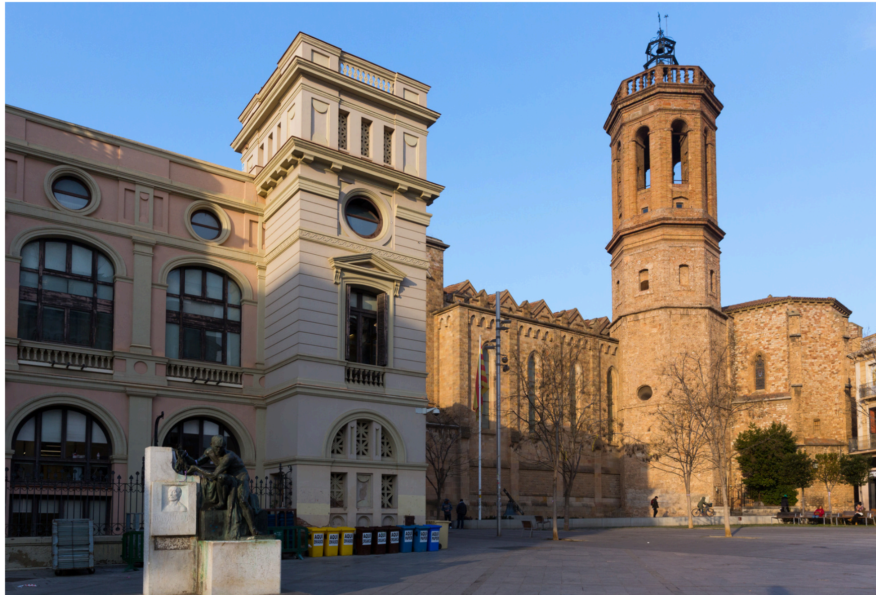
Ajuntament de Sabadell

Les Dàlies t'ofereix un estil de vida inigualable i totes les comoditats que pots desitjar al teu abast : a poca distància a peu de botigues, restaurants, parcs, escoles, transport públic i amb accés ràpid a les principals vies de comunicació.