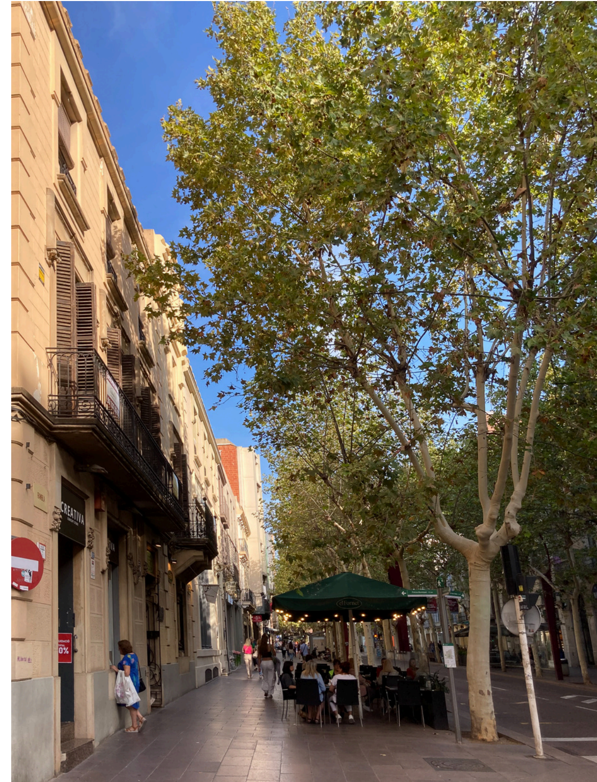
Rambla de Sabadell